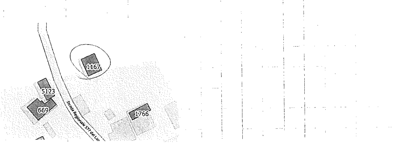
MAPPA DELL'AGGREGATO STRUTTURALE CON IDENTIFICAZIONE DELL'EDIFICIO