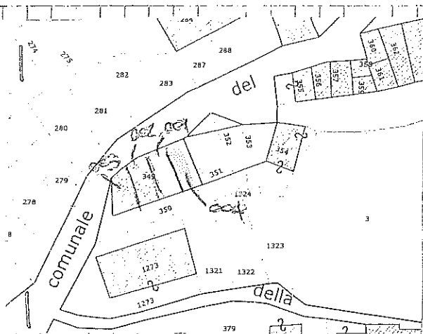
MAPPA DELL'AGGREGATO STRUTTURALE CON IDENTIFICAZIONE DELL'EDIFICIO