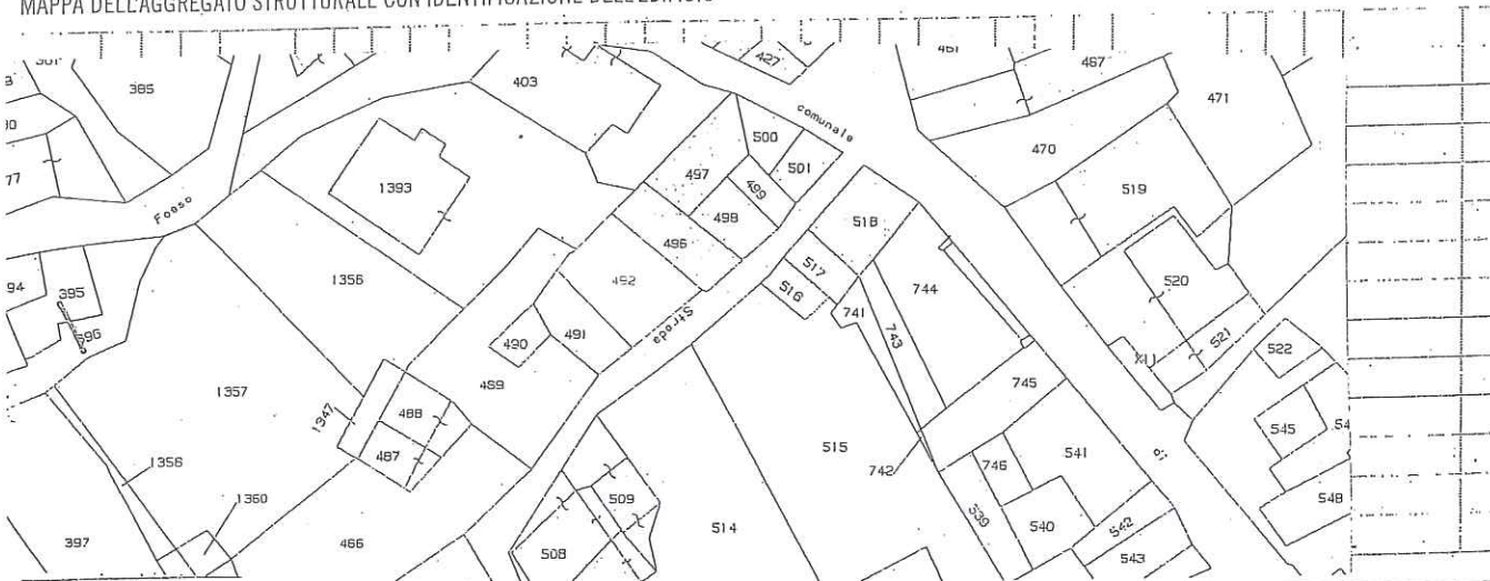
MAPPA DELL'AGGREGATO STRUTTURALE CON IDENTIFICAZIONE DELL'EDIFICIO