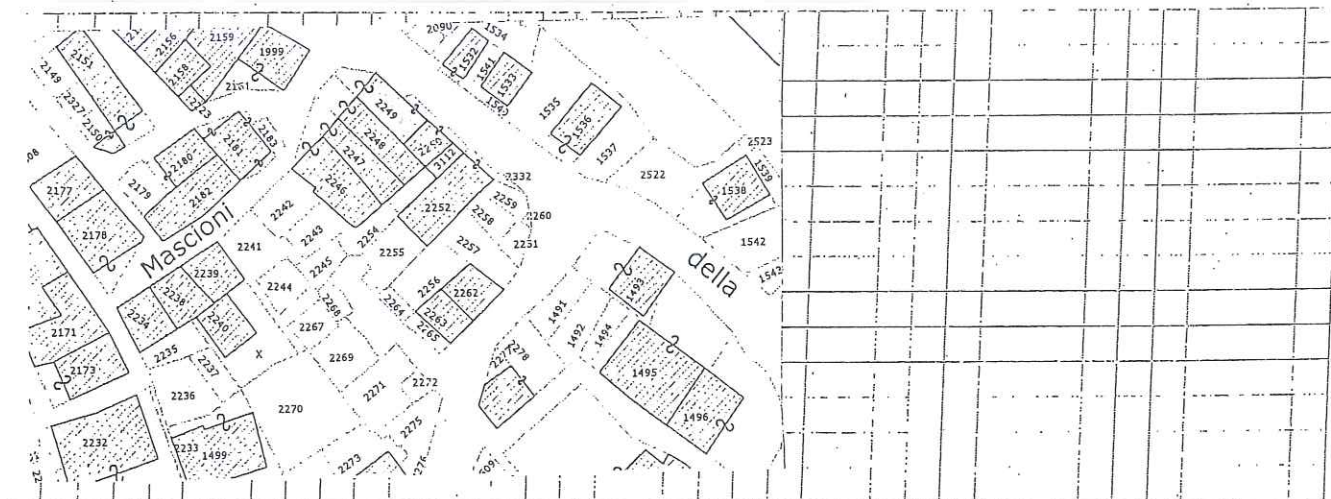
MAPPA DELL'AGGREGATO STRUTTURALE CON IDENTIFICAZIONE DELL'EDIFICIO