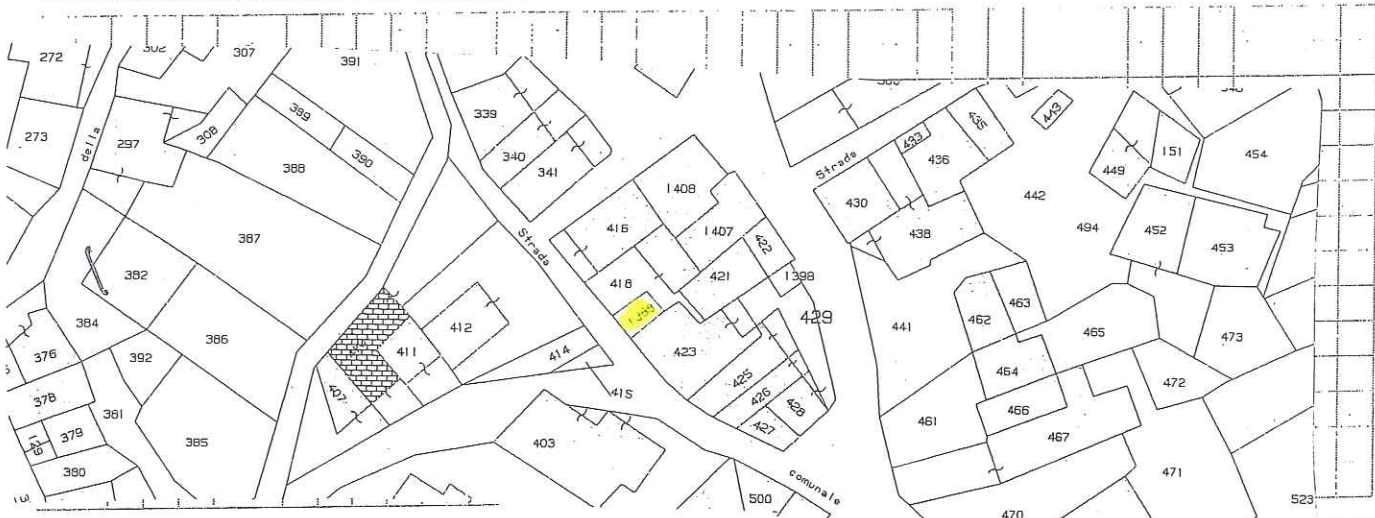
MAPPA DELL'AGGREGATO STRUTTURALE CON IDENTIFICAZIONE DELL'EDIFICIO

DENOMINAZIONE EDIFICIO O PROPRIETARIO FULVI NICOLA