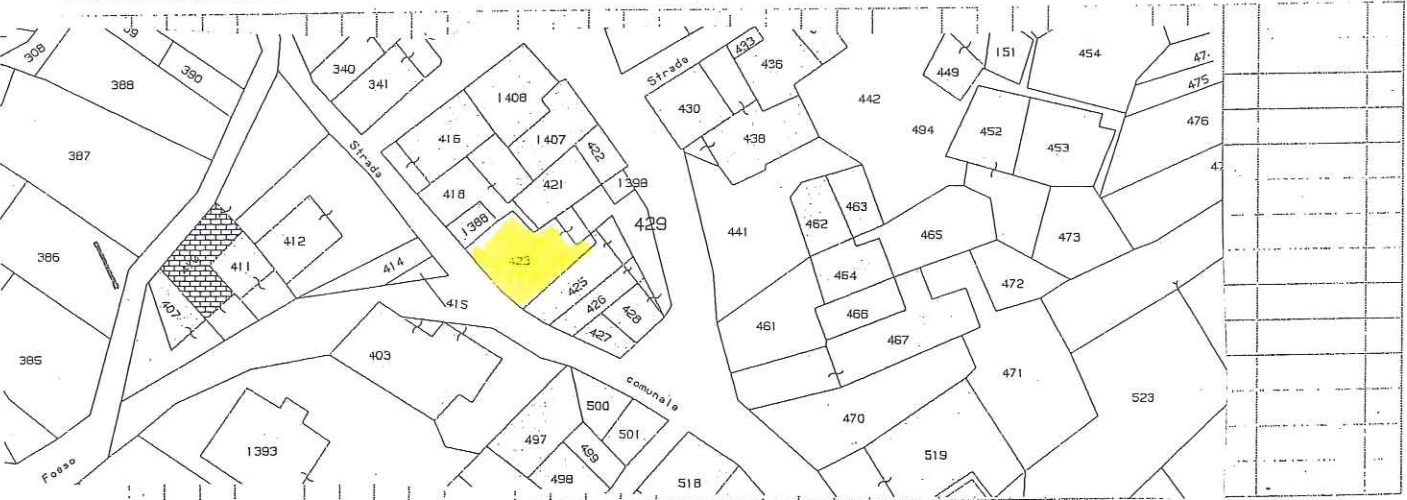
MAPPA DELL'AGGREGATO STRUTTURALE CON IDENTIFICAZIONE DELL'EDIFICIO

DENOMINAZIONE EDIFICIO O PROPRIETARIO FUUVI MICIOLA