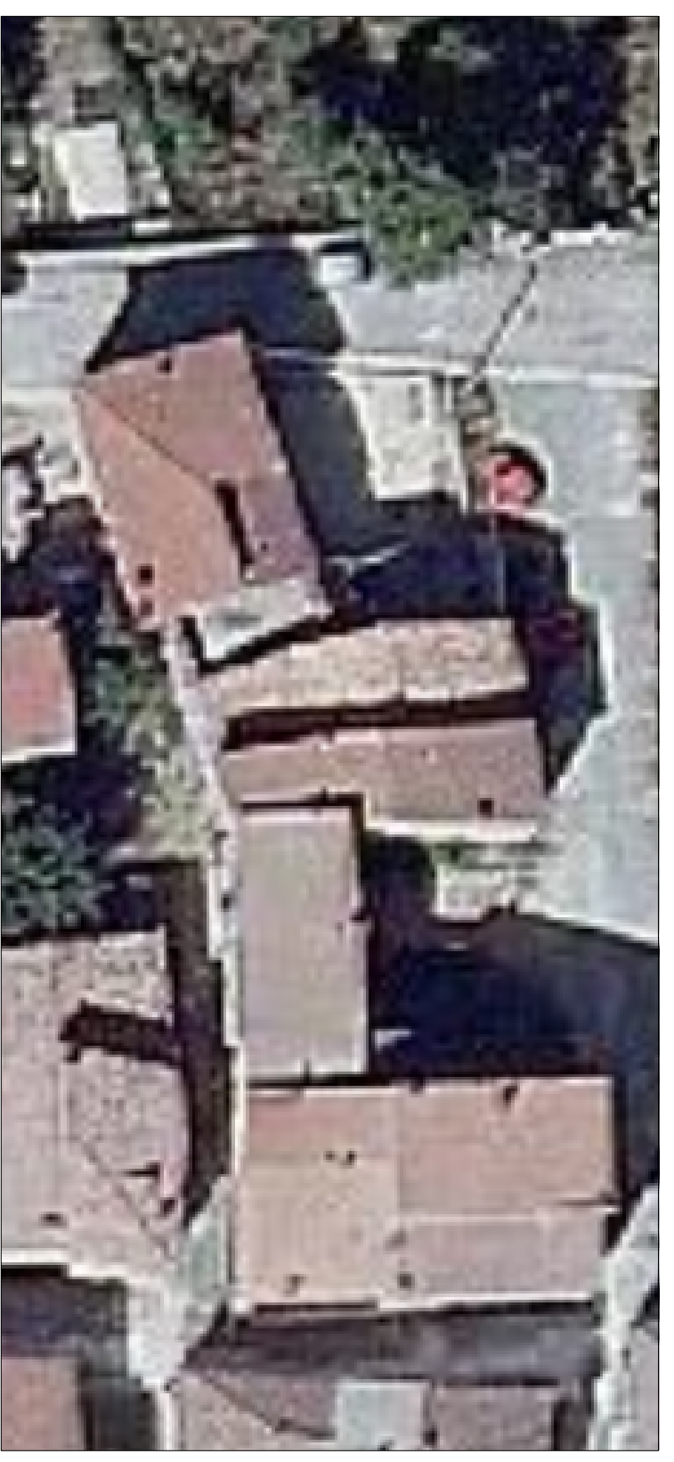
Ortoimmagine di riferimento