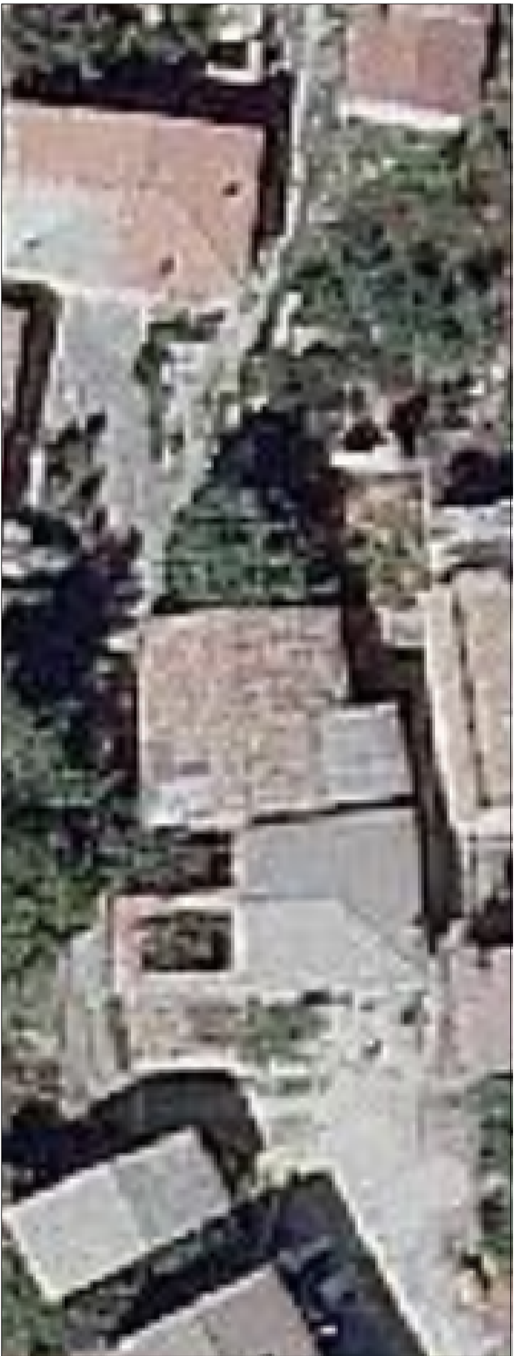
Ortoimmagine di riferimento