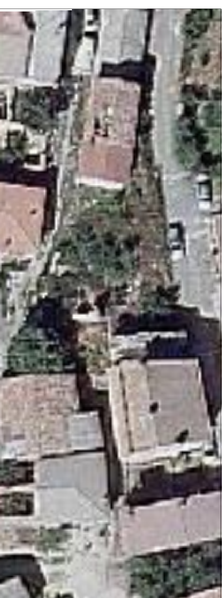
Ortoimmagine di riferimento