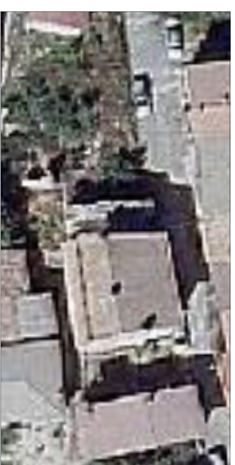
Ortoimmagine di riferimento