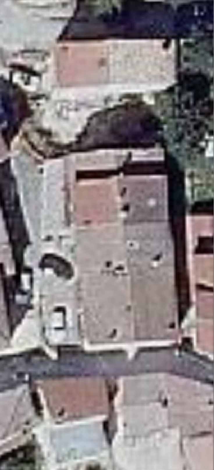
Ortoimmagine di riferimento