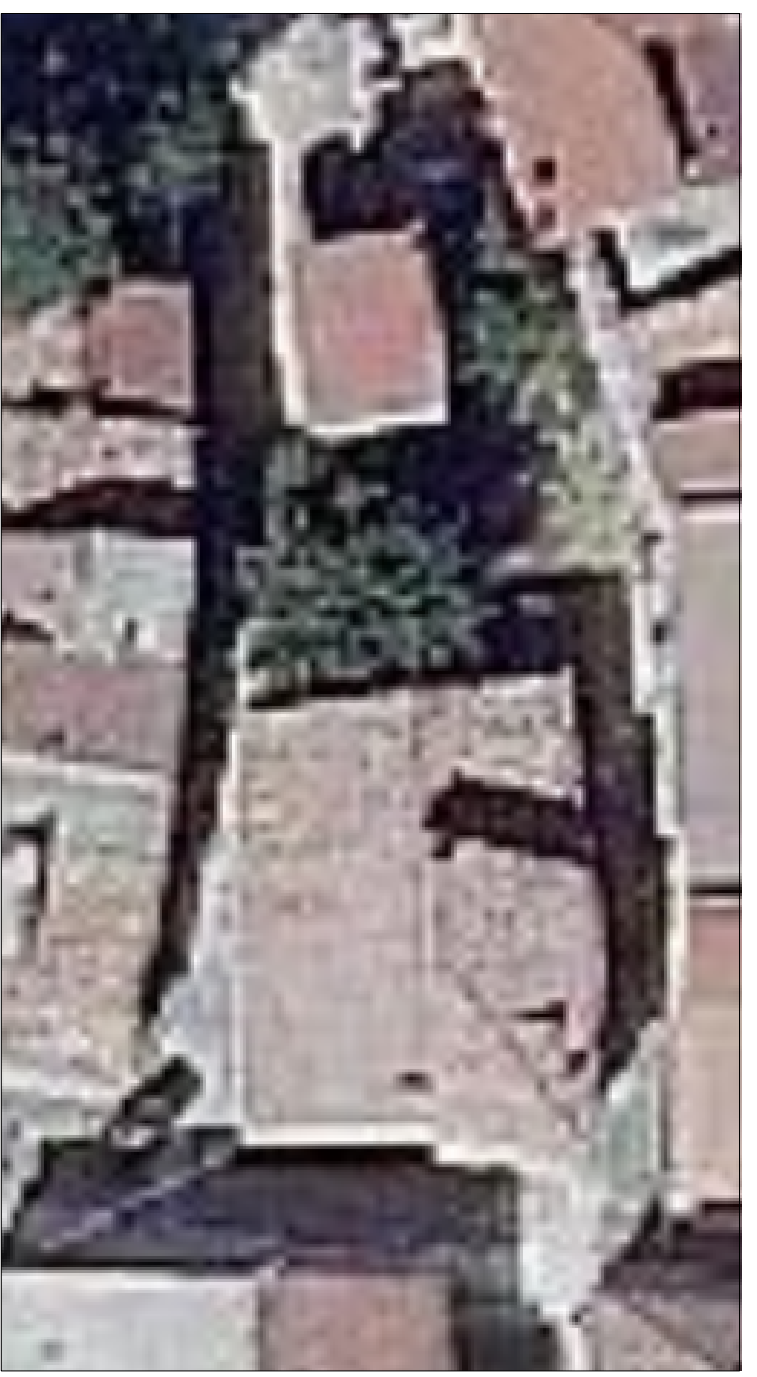
Ortoimmagine di riferimento