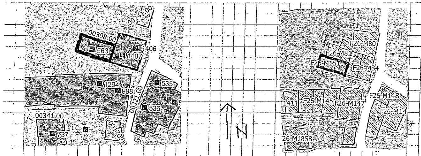
MAPPA DELL'AGGREGATO STRUTTURALE CON IDENTIFICAZIONE DELL'EDIFICIO